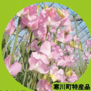
寒川町特産品 スイトビー