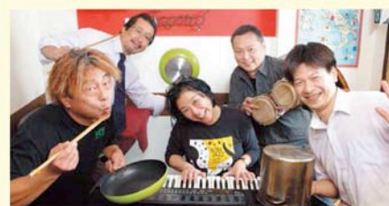
ホットシェフ (相模大野)