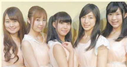
チーム S.K.S (寒川)

主催：公益社団法人商連かながわ かながわ商店街観光ツアー委員会 あきんどの祭典部会