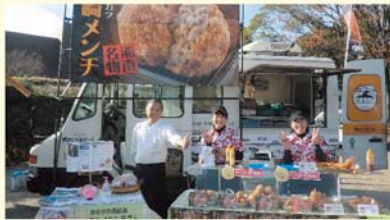
レストランなんどき牧場