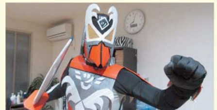
湘神ライダー (辻堂)