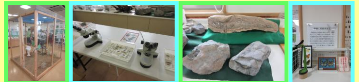
蝶の生態や顕微鏡での観察、古代の化石なども展示しています!!