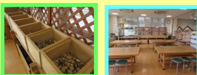
クラフト・キーホルダー・竹とんぼ・紙粘土