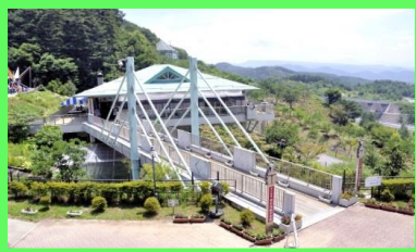
昆虫体験学習館に行ってみよう!!