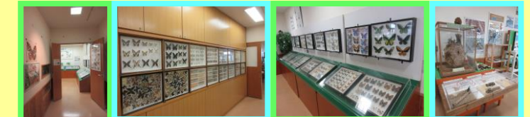
館内には国内や世界各地の様々な標本が展示されています!!