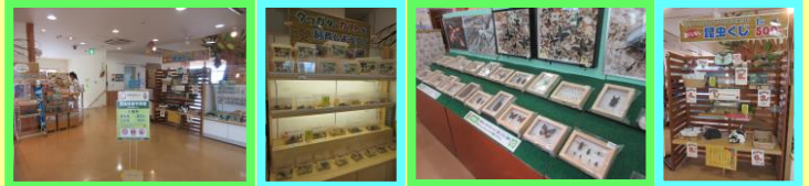
中に入ると昆虫の世界!! 生きている昆虫から標本まで販売しています!!