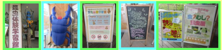
大きいクワガタがお出迎え!! 実施中のイベントなどの告知看板!!