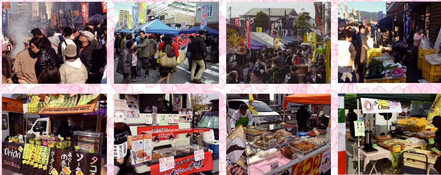
※画像はこれまでの神奈川県内で行われた朝市の様子です。今回出店する店舗とは限りません。

主な参加店舗 ▶ 魚っ香・浜コロ・柿屋・城田屋製菓・アクアカラー・Jpy&Moris・アイル・オオヒロ商会 沖縄宮古島物産・富貴包子楼・高甚商店・杉山商店・トニー食品・なんどき牧場など 30 店舗以上が集結。